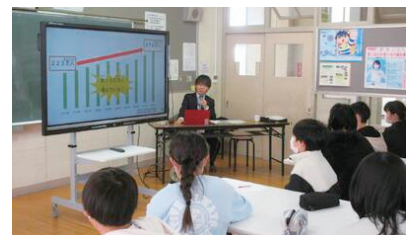
業務の様子（小中学校への出前講座）

先述した2つのアウトリーチ事業を進めていく上で、私自身の自治体出向の経験や多文化共生マネージャーのネットワークなどによる横のつながりは非常に役に立っている。これからも外国人コミュニティや支援団体から御助言などをいただきながら、一層の連携を図った上で、アウトリーチ事業の拡大に尽力したい。