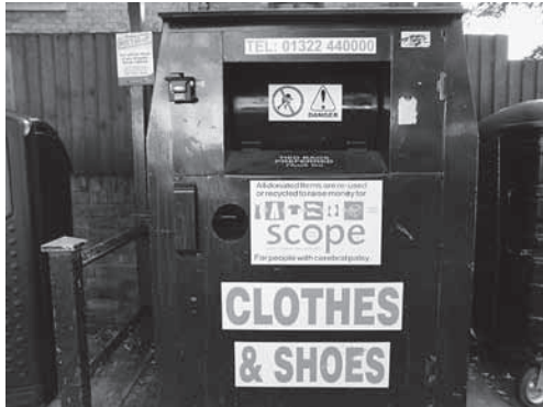
不要となった衣服や靴の回収箱

一人当たりの月額平均寄付額は31ポンド（約4,185円）、月額平均寄付額の中央値は12ポンド（約1,620円）でした。これらの数字は高額寄付者がいることも考えられますが、チャリティに対する国民の裾野の広さ、意識の高さをうかがわせます。