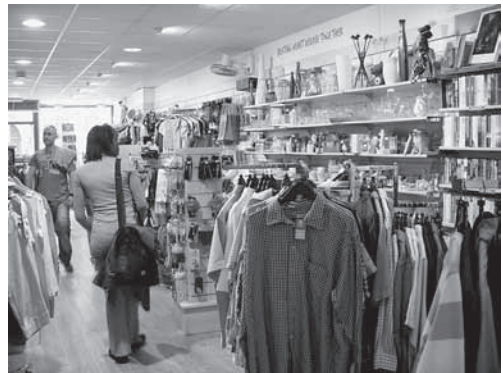
チャリティショップの店内の様子