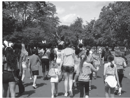
参加者は病気と闘う家族や親類、友人へのメッセージを背中に掲げて5kmを完走しました。

開催された、Cancer Research主催の「Race for Life」に参加しました。このチャリティイベントは、国内最大手のスーパー・テスコがスポンサーを務め、夏に国内300の会場で開催されます。ランナーはすべて女性で、去年の参加者数は69万人、6000万ポンド（約81億円）の寄付が集まりました。主催者は今年度の目標寄付額を8000万ポンド（約108億円）としています。同僚が私のスポンサーになってくれ、わずかですが私も寄付を集めることができました。