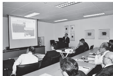
公園利活用に関する事例説明

2011年8月には地域経済の活性化を目的に、公園利活用の事例を調査するため、福岡経済同友会の一行が来豪されました。この際、シドニー事務所では福岡県からの依頼により、シドニー都市圏における公園利活用に関する事例調査を行うとともに、調査団に対する資料提供と説明を行いました。