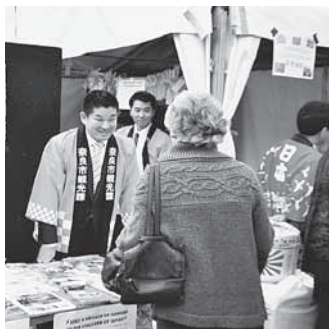
クレアのブースで自らPRを行う奈良市長

豪し、東日本大震災復興支援として奈良市の姉妹都市である宮城県多賀城市への応援メッセージの記入をキャンベラ市民に呼びかけました。シドニー事務所では奈良市からの依頼に基づき、事前の連絡