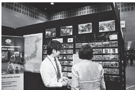
クインズランド州自治体協会総会でのブース展示

シドニー事務所では、オーストラリアの地方自治体との連携強化、各地の行政課題の把握を目的に、各州の地方自治体協会が開催する年次総会に参加しています。2011年度は