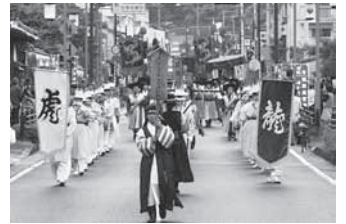
韓国ベクヤン高校（宮中吹打隊）