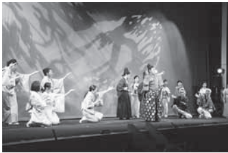
ミュージカル「対馬物語」