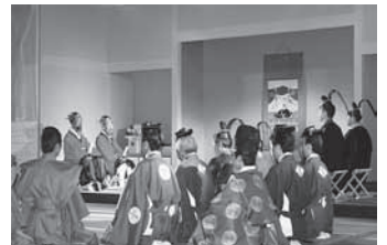
対馬易地聘礼（国書交換）儀式

釜山では、毎年5月に龍頭山公園一帯で「朝鮮通信使祭り」を開催しており、朝鮮通信使のパレードはもちろん、日韓の芸能団の公演等が大規模に開催されますので皆様のお越しをお待ちしております。