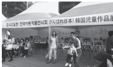
がんばれ日本！韓国児童作品展示会

クレアソウルでは、「おまつり」の企画・運営、各県ブース等の運営に計8名が参加し、日本と地域のPRに努めました。今回の「おまつり」は、会場が賑わうとともに多くの韓国メディアにも取り上げられ、「日本・東北の元気」を発信できました。