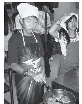
チヂミ作り体験の様子