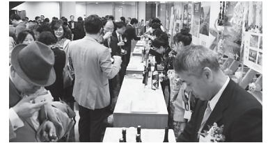
被災地の地酒を堪能する参加者

ージを発信し、「日本の元気」を韓国でアピールするため、「日本文化講演会・日本酒試飲会」を2011年10月25日(火)に開催しました。会場となった韓国外国語大学には、日本に対する関心が特に高い日本研究者及び日本語教育者、約200名が来場し大いに賑わい、好評を博しました。今後、ご参加頂いた先生方の「口コミ」による日本酒の需要拡大、日本のイメージダウンの払しょく、日本への観光客数の回復への良い影響を期待しています。