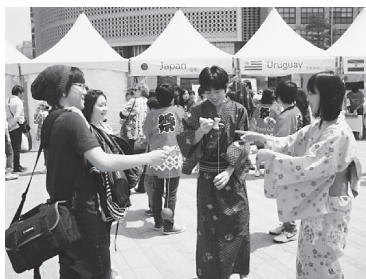
浴衣を着てけん玉を実演する日本人学校の中学生たち

Seoul Friendship Fairは、ソウル特別市が主催するおまつりで、世界各国の伝統文化や食品などを紹介・販売し、交流を深めるものです。今年度は2011年5月7日～8日の日程で、好天に恵まれる中、ソウル市庁前広場とその周辺で開催されました。クレアソウルはSJC（ソウルジャパンクラブ）の一員として、浴衣の試着やけん玉、ヨーヨー釣り等、伝統遊具を紹介。日本では渋い色の浴衣も好まれますが、