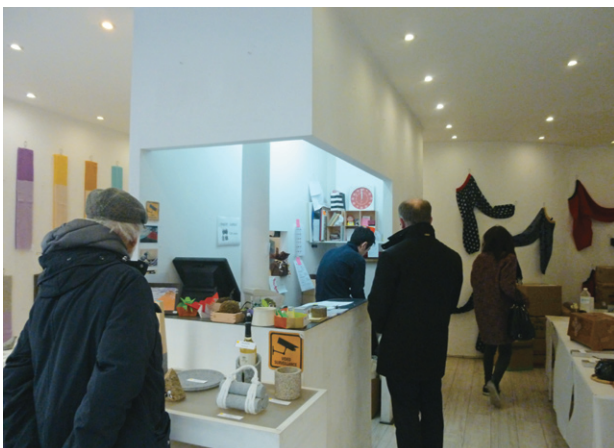
店舗での展示販売の様子

今年は、パリ日本文化会館での展示の後、16日から25日までの間、初めての試みとして、パリ中心部のショールーム兼店舗で展示販売を行いました。これまでの来場者の方々から、購入はできないのかという問い合わせが多数あったことから、その要望に応えるために実現したものです。展示品の中から、販売希望のあった製品を展示販売しました。実際に購入されたのは、そのうちの約2割でしたが、販売することにより、その値段設定がフランスの方々にとって実際に受け入れられるか、買いやすいか、あるいは高くて手が出ないのか、など知ることができる有益な機会です。展示の際の来場者の反応も重要ですが、展示のみならず販売することで、初めて製品のフランスでの市場価値を実感できるのではと感じました。