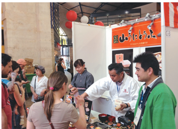
多くの人を集めた熊本県五木村の特産加工品「山うにと豆腐」