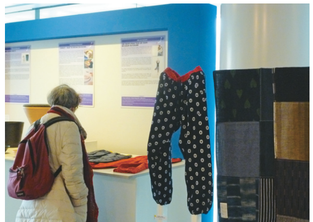
久留米絣の展示品に見入る来場者

出展品とそれに対する来場者の反応をいくつかご紹介します。久留米絣は、福岡県筑後地方に伝わる綿織物ですが、その「くる」「そめる」「おる」という三つの技術は国の重要無形文化財に指定されています。今回の出展では、独特の風合いを活かし、現代的デザインを施し、日常を快適に過ごすパンツ（モンパン）とショールが出品されました。これらの作品は、フランスの方々から、「デザインがかわいい」、「履きやすそう」などの好意的な意見をいただきました。