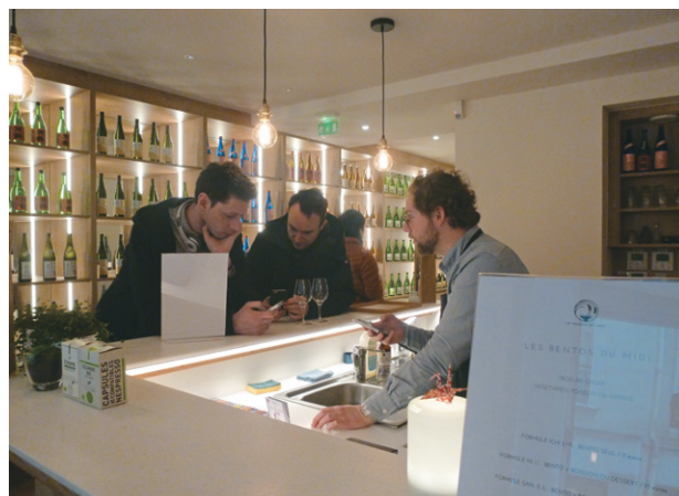
佐賀の日本酒が並ぶ「La Maison du Sake」店内

業（地域活性化・地域住民生活等緊急支援交付金）として助成を行い、出展する運びとなったそうです。