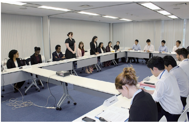
2019 年度第 1 回 AJET 全国役員意見交換会の様子

AJET 全国役員 (9人)、総務省 (3人)、外務省 (1人)、文部科学省 (2人)、クレア (9人) が出席し、各出席機関が提案した6つの議題 (勤務時間と報酬に関する研究レポート (AJET)、JET プログラム参加者と地域の関わり (総務省)、英語教育実施状況調査結果と ALT の活用について (文部科学省)、JETAA 国際会議について (クレア)、Rugby World Cup 2019 および東京オリンピック・パラリンピック競技大会 (インターンシップおよびボランティア) について (クレア)、東京オリンピック・パラリンピック競技大会の開催による JET プログラム参加者の任期延長について (クレア)) などの意見交換を行いました。