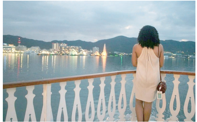
外輪船「ミシガン」からの眺めを楽しむ参加者

ドレスコードとして、「カクテルアタイア」(個性を強調したフォーマルな服装) などが指定され、参加者はお互い負けないほどおしゃれな服装で参加します。ネクタイ、アクセサリーやカラフルなドレスは、見るだけでも楽しく、参加者は個性的なファッションセンスを披露しながら、夕方の涼をゆっくり楽しみます。