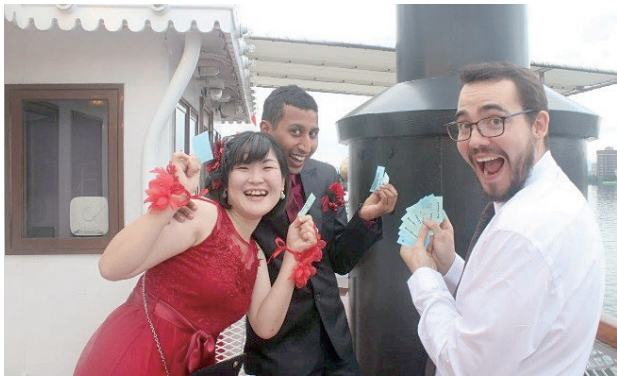
ファッションコンテストを楽しむ参加者

今後も、AJET 支部は JET プログラム参加者のためのイベントを引き続き企画し、実施する予定です。