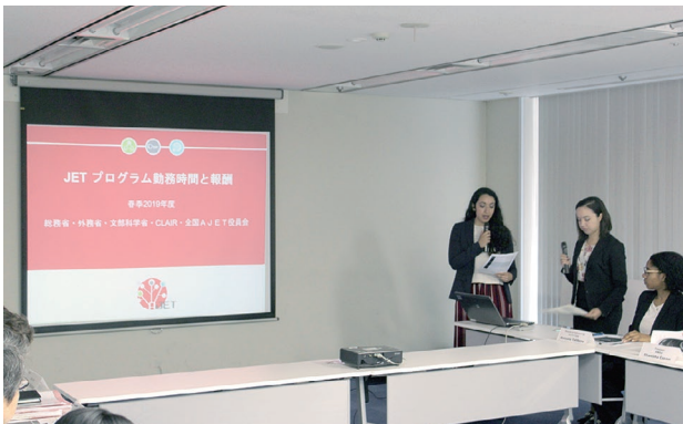
「勤務時間と報酬に関する研究レポート」を説明する AJET 役員