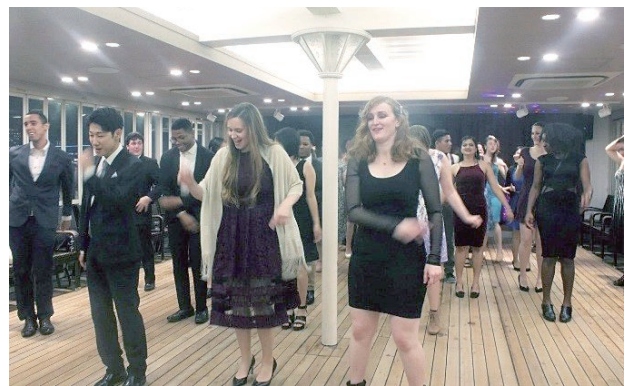
ダンスを楽しむ参加者

また、参加者はダンスも楽しみます。ミシガン内のバーで心臓に響く音楽を流すと、そこはダンスフロアに早変わりします。混みあいながらも笑顔が溢れるダンスフロアで、皆と一体になってダンスをする参加者もいる一方、デッキや屋上で夕暮れを眺めながら、久々の再会を祝う参加者もいます。