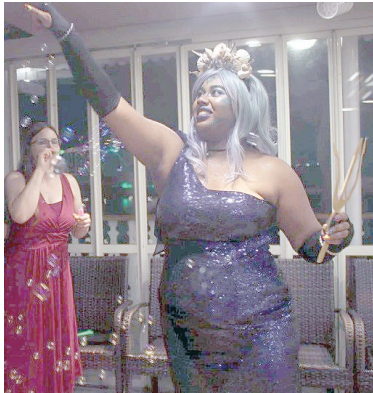
「海の女王」あるいは「クイーン・ネプチューン」と呼ばれた優勝者

手作りの素晴らしい貝殻のティアラを付けていました。会場のどこに行っても注目を集めた彼女は、一晩中「海の女王」や「クイーン・ネプチューン」と呼ばれ、多くの票を集めて優勝しました。