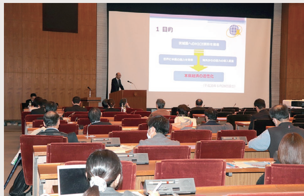
MICE 開催支援セミナーの様子

これからも、海外勤務の貴重な経験を糧とし、それにより出会えた方々とのご縁を大切にしながら、日々成長していければと思います。