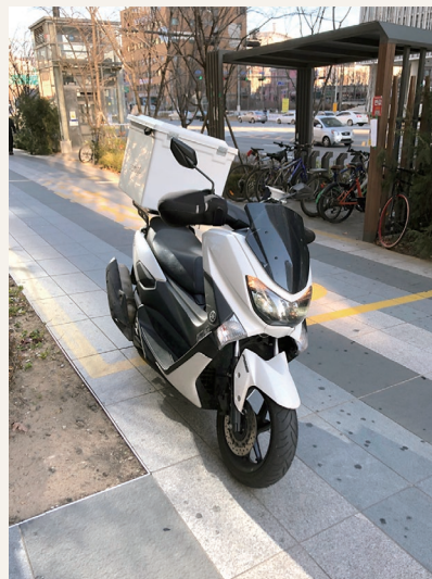
ペダルサービスのオートバイ

また、ソウル市内を流れる漢江の河川敷には、週末、ピクニック等の余暇を楽しむたくさんの人がいますが、そこには「ペダルゾーン」と呼ばれるペダル受け取り場が設置されていて、注文したものをそこ