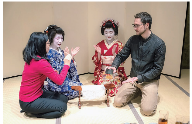
浅草のプログラムでは、衰退の危機がある芸者文化を応援するストーリーを盛り込む

今後は、地域自体の滞在性やサステナブルへの対応要素を再構築・編集し、取り組みを発信していくことが、地域を応援してくれる層の誘客につながるだろう。地域の好循環に貢献するようなサイクルの創出に期待したい。