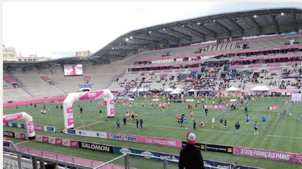
EKIDEN (フランス語でも通じます) 大会の様子

私はこの4月に、パリマラソンへの出走を予定しています。日頃は自分自身と向き合って走っていますが、この日だけはパリ市内の有名観光地に目を奪われつつ、楽しんで走りたいと思います。