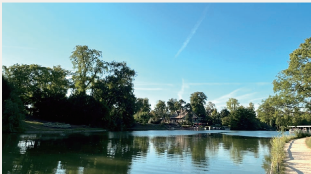
ブローニュの森にある池と遊歩道

私は普段、パリ西部にあるブローニュの森でランニングを楽しんでいます。ブローニュの森は、東京ドーム約180個分の広大な敷地の中に、池や公園などの自然空間はもちろん、レストランや美術館、競馬場などの施設も有しています。そのため、休日には多くの人々がブローニュの森を訪れるものの、広大な敷地のおかげで、人が密集して走りにくいといったことはなく、ランナーにうってつけの環境が整っています。