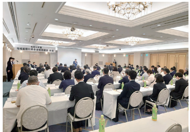
2023年度の総会の様子

新型コロナウイルス感染症が2023年5月8日より2類相当から5類に移行したことを踏まえ、2023年度は対面形式で5月22日に開催したところ、51団体61名の方にご出席いただき、盛況のうちに終えることができました。