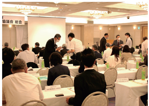
全国各地から地域国際化協会が集い交流を図る

連絡協議会では年に1度、総会を開催しています。2020年度・2021年度の総会は、新型コロナウイルス感染症の影響により書面開催となり、地域国際化協会が対面で交流する機会を設けることができませんでした。