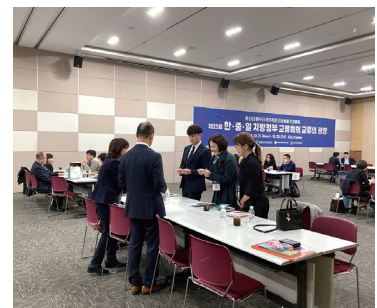
交流の広場の様子