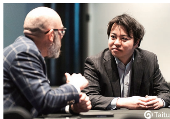
ワークショップでNZの地方自治体関係者と意見交換をするクリアシドニー事務所職員

クリアシドニー事務所もこれらの講演やワークショップへ積極的に参加し、現地の地方自治体関係者との意見交換を行いました。あわせて、クリアの組織概要の説明や海外自治体幹部交流協力セミナーの周知、日本とNZ間の姉妹都市に関する情報提供などを行いました。この年次会合への参加を通じ、NZの地方自治体が直面する課題や将来の懸念事項について認識を共有するとともに、NZの地方自治体とのネットワークや今後の協力関係をさらに強化することができました。