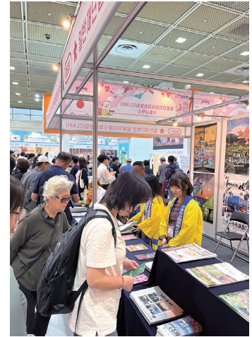
ブース出展の様子