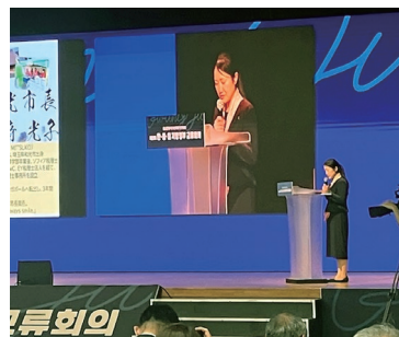
自治体発表の様子