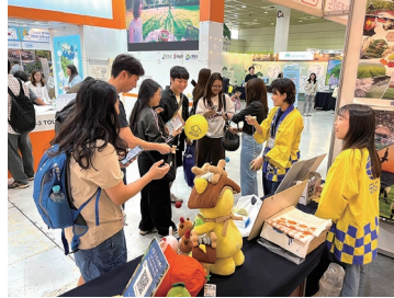
けん玉に挑戦する来場者の様子

今後もクリアソウル事務所では、SNSなどのソーシャルメディアを積極的に活用しながら、日本の地方自治体の魅力を積極的に発信していきたいと思っております。