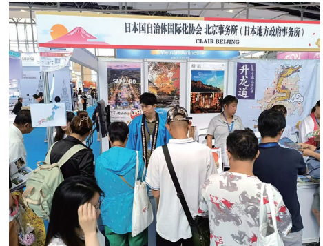
来場者でにぎわうクリアブース

クリア北京事務所は、出展者の中で最も多くの団体を取りまとめ、熱心なPRを行っていたことが評価され、主催者から最優秀組織賞を受賞することができました。