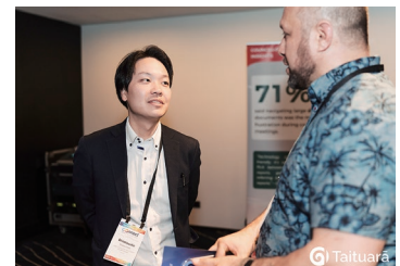
NZの地方自治体関係者と交流するクリアシドニー事務所職員