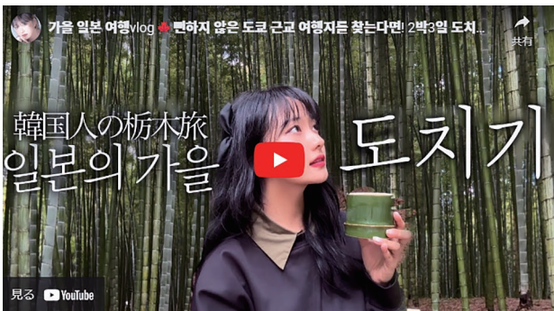
YouTube 動画 (栃木県) のサムネイル

宇都宮市では、宇都宮を代表するグルメ「宇都宮餃子®」を取材した後、竹林面積日本一を誇る「若竹の杜 若山農場」を取材しました。映画やドラマの撮影地としても有名な竹林の散策や、竹の器での抹茶体験、竹灯り制作体験を撮影しました。