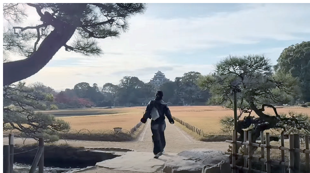
岡山後楽園の取材の様子

観地区では、デニムでできた着物をレンタルして取材し、デニム・ジーンズ産業が盛んな岡山ならではの観光を PR しました。そのほか、2023年に再開した仁川空港から岡山桃太郎空港への直行便運航情報についても PR しました。