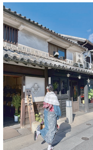
倉敷美観地区の取材の様子

視聴者からは、「岡山という地名は聞き慣れていましたが、これほど見るところが多いとは知らなかったです。行ってみたいくなりました」「岡山に行こうと思っていたため最高の動画でした」など、コメントが多数寄せられました。