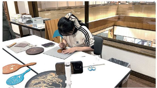
日光彫を体験する様子

に乗って東京からのアクセスについても PR しました。最後は、日本三大イルミネーションの 1 つである「あしかがフラワーパーク」を取材して旅を締めくくりました。