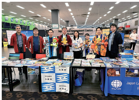
クリアシドニー事務所ブース集合写真

クリアシドニー事務所は、オーストラリア・ニュージーランド各地の日本関連イベントに数多く出展しています。イベントへの共同参加や、各地のイベントでの自治体のPRに関心がございましたら、ぜひお気軽にご連絡ください。