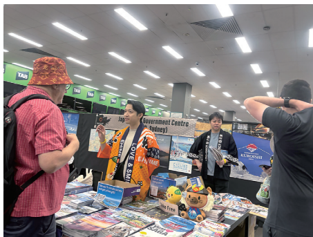
日本の魅力をPRするクリアシドニー事務所職員