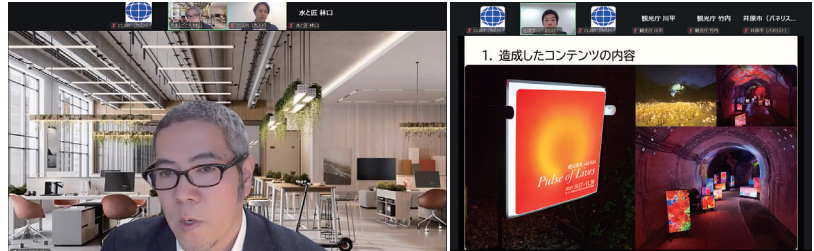
当日のセミナーの様子