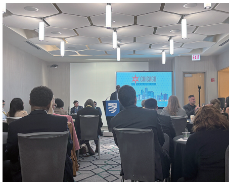
セッションの様子

（注）ONE BIG BEAUTIFUL BILL ACT (OBBBA) IMPACT ON NEW YORK COUNTIES, NYSCA REPORT, July 2025