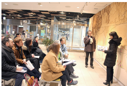
せんだい 3.11 メモリアル交流館の視察

セミナー期間中は終始活発な意見交換が行われ、参加者と受入れ自治体双方にとって多くの気づきを得られる有意義な機会となりました。