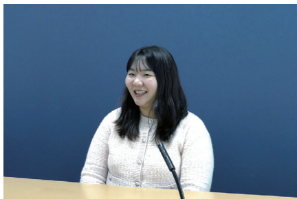
取材風景（世宗特別自治市）

クレアソウル事務所では、現役の JET プログラム参加者や JET を目指す方々向けに JET プログラム終了後の進路やキャリアについて発信する動画を制作し、ホームページで公開しています。2025 年度も新たに 3 人の JET 経験者への取材を行い、JET プログラム参加中に自治体で担当していた業務内容や地域での活動、現在の仕事に至るまで、さまざまなお話を伺いました。また、JET プログラムでの経験が終了後の進路決定にどのような影響を与えたのか、当時の活動が現在の仕事にどのように生かされているのかについても、具体的なエピソードを交えて紹介していただきました。JET プログラムでの経験が、翻訳や通訳といった専門的な技術の向上のみならず、仕事の進め方やコミュニケーションの取り方といった実務への理解の促進や、自国文化へのさらなる認識の深化など、多方面で大きな財産となっていることがうかがえました。この動画を多くの方に見ていただき、JET としての活動が地域の国際化への貢献にとどまらず、自身の成長やキャリアアップにつながる素晴らしい経験であることをさらに広く発信していきます。