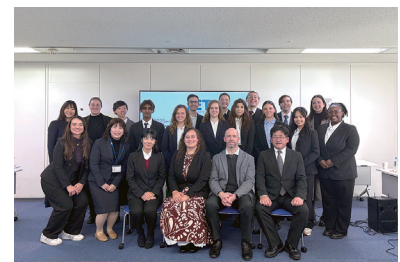
AJET 意見交換会集合写真