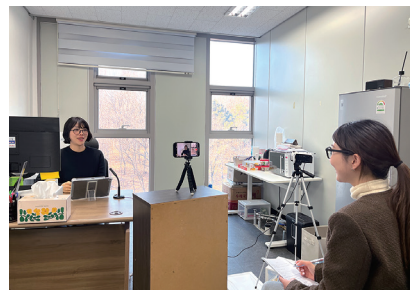
取材風景（クレアソウル事務所内）