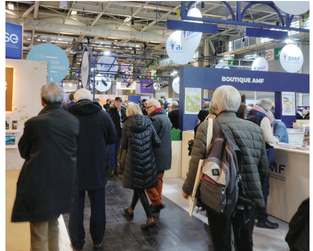
にぎわう会場内の様子

人が来場し、前年に比べて 8.4%の増加を記録しました。また、出展者数は 1,380、講演回数は 448 回にのびりました。フランスでは 2026 年 3 月に統一地方選挙を控えていることから、例年以上に地方選出議員やその関係者が積極的に参加し、今回の盛況につながったものとみられます。