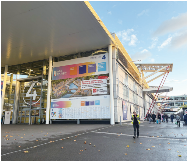
出展パビリオンの外観

2025年11月18日(火)から20日(木)までの3日間、パリ市南西部にあるポルト・ド・ヴェルサイユ見本市会場にてサロン・デ・メール (Salon des Maires et des Collectivités Locales) が開催されました。