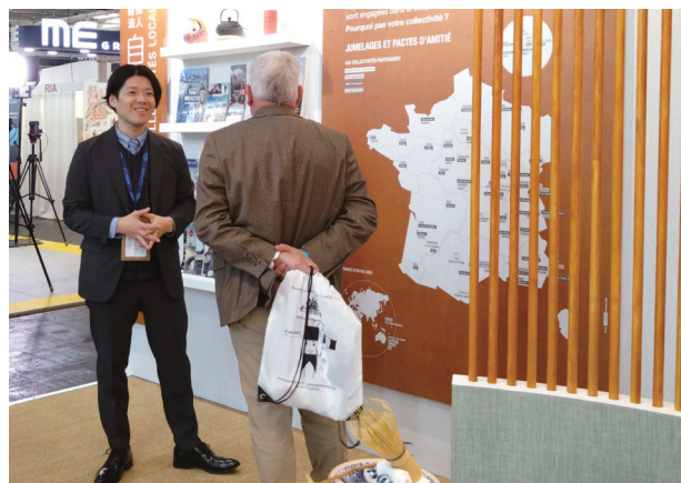
来場者と交流する所長補佐