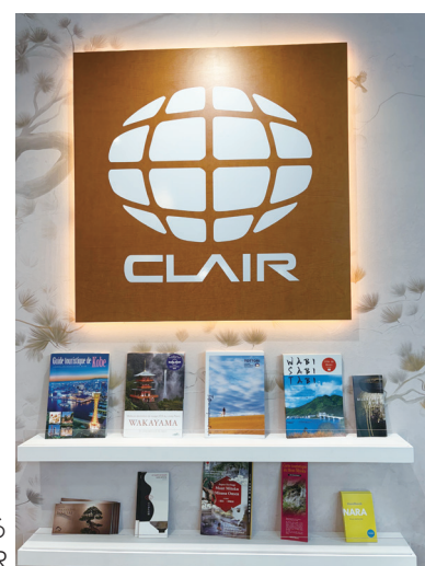
パンフレットによる自治体 PR

今後のさらなる日仏交流の発展に向け、次回のサロン・デ・メールでも多くの来場者にお会いできることを楽しみにしています。