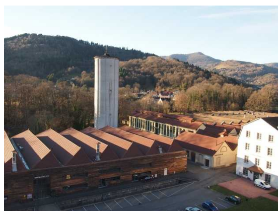
企業用建造物の外観。右側の白い建造物には、アソシエーション等が集積している

これら県等による一連のプロジェクトが進行する中、コミューン共同体は、2003 年のブサックの工場の完全閉鎖後、その翌年に 24 ヘクタールの土地及び 60,000 平方メートルの建造物を買収した。地域の経済発展に関する権限を有するコミューン共同体が産業資産全体を買収したことにより、経済発展の文脈で建造物群の再整備が開始されたのである。ブサックの工場の閉鎖前にも、地域における繊維工場の閉鎖が相次ぎ、深刻な問題となっていた。行政としては、工場跡をそのままにしておく、という選択肢もあるが、遅かれ早かれ、建物の解体と土壌浄化が必要になり、それにかかる費用はより多額になる。そのため、コミューン共同体はブサックの工場閉鎖後に迅速に工場を買収し、インキュベーターや企業向け賃貸オフィス等企業向けの用途として活用することを決定したのである。