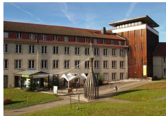
繊維産業博物館の外観

アルザス繊維産業博物館プロジェクトは、現在の博物館に隣接する1819年の建物の中に、19世紀に存在した生産設備を再現し、当時の繊維技術を使用して実際に生産を行う