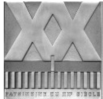
20世紀遺産のラベル

基本的なスキームとしては、州文化局が運用し、既に国内法で保護されている物件や、地方ごとに設けられたワーキング・グループが作成した暫定リストから選定される。ラベルの授与にあっては、所有者の同意が必要であり、最終的にラベルを与えられた物件には、ロゴ入りタイププレートが授与されている。本ラベル制度では、