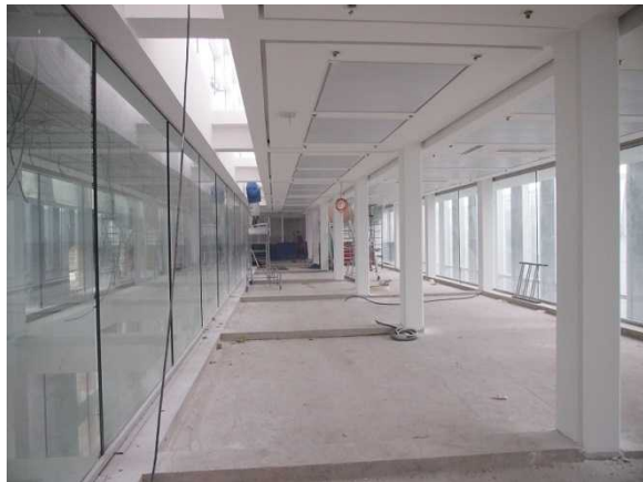
砂糖市場倉庫の内部（2014年2月撮影時）

ダンケルク大都市共同体は、これまでも持続可能な開発に基づいた施策を実施してきている。EU市長誓約の調印者である共同体は、アジェンダ21及び気候計画を策定し、2011年にはシテネルジー（Cit'Énergie） 8 ラベルを取得した。ダンケルク大都市共同体は、ゴミの分別に関するパイオニアでもあり、廃棄物の削減、リサイクル、再利用を奨励している。また、暖房や断熱に関する情報提供や、新エネルギー導入に係る補助事業を住民に提案している。砂糖市場倉庫の改修方法は、まさにこのような施策の一環をなすものである。