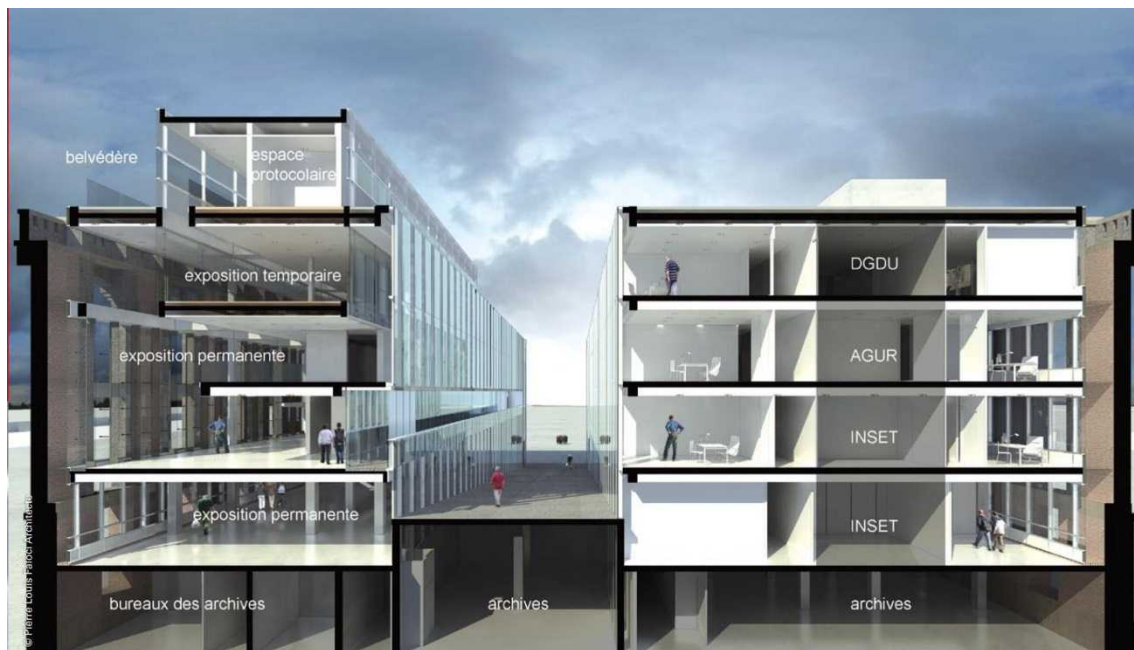
改修イメージ図 (断面図)

ラーニング・センターは、大学、企業、建築家、観光業関係者、若者等で構成される「フォーカスグループ」との協議、ヒアリングを通して将来の使用方法を検討しているが、さらに、倉庫に入居する組織の関係者等で「事業推進委員会」を設置し、実施事業や今後のプロジェクトについて検討がなされる予定である。また学術関係者や専門家で構成される「方針検討委員会」も 2014 年に設置され、重層的な体制の中で政策が展開されていく。