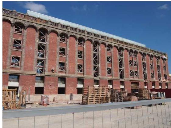
砂糖市場倉庫の外観（2013年5月撮影時）

19世紀末、フランス第3の港であったダンケルク港は、大きく発展しつつあった。当時、植民地産の砂糖を大量に貯蔵する必要性から、ダンケルク商業会議所は大規模な倉庫を第一埠頭に建設することになった。1895年10月26日付デクレによって国より建設許可がおりた。