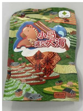
（図3-1）小馬遇見大海ブランドの商品パッケージ 60

また、本イベントでは「小馬遇見大海」という名称の桂林米粉のポップアップストアがオープンし、中央広播総台を通じて招かれた著名な15名のタレントにより、桂林米粉の試食や調理体験が実施された。イベントの様子は、北京、上海、重慶、成都、広州、西安、湖州などの7大都市のランドマークスクリーンで大々的に広告され、SNSを通じて1,500万人以上がオンラインで視聴するなど、特に若年層の消費者層の間で全国的な話題となった。このプロモーション戦略により、桂林米粉のブランド認知度が飛躍的に向上し、新たな市場の開拓にも貢献した。また、「小馬遇見大海」ブランドは桂林市人民政府に寄贈され、イベント後も同ブランドを用いた商品がネット上で販売されており、ブランド化が着実に進んでいる。