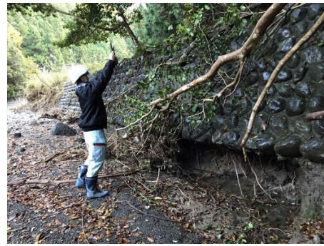
Illustration 1 : Réalisation de mesures 3D sur un site endommagé

Puisque nous n'en sommes qu'au début de l'utilisation des terminaux équipés d'un capteur LiDAR, il existe certaines difficultés. Nous espérons tout d'abord en améliorer la productivité en prenant pour objectif une gestion des infrastructures basée sur le système Virtual Shizuoka et les capteurs LiDAR des appareils mobiles, ainsi que par la formation du personnel qui exploite les données de nuages de points et la promotion de cette technologie.