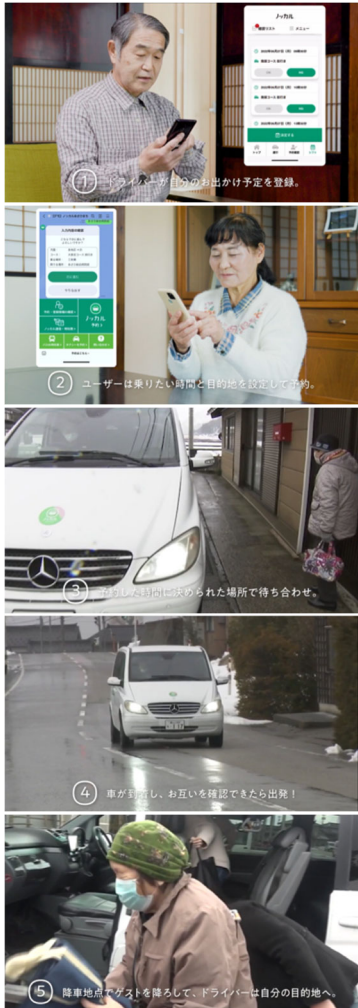
Photos: fonctionnement de Nokkaru Asahimachi