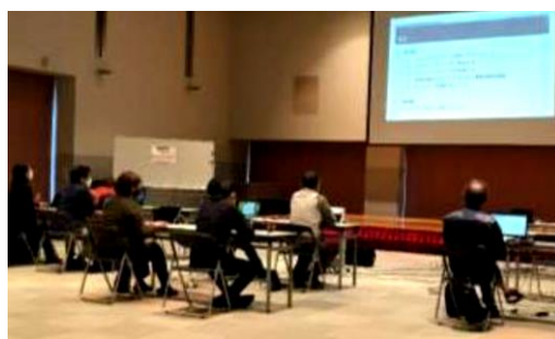
【オンラインによる日本語学習支援入門】

コロナ禍が収束すれば、在住外国人の増加(子どもを含めて)が想定されることから、今後は県全体で日本語学習支援・日本語教育について話し合う機会の設定や、支援の枠組みづくりを進める必要がある。