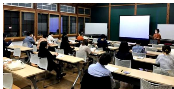
【日本語ボランティア育成研修】

オンラインによる学習支援セミナーは、県内4地域で計4回実施し、25名が参加した。オンラインの会議に出席したことはあるものの、自分がホストとなり主催側にまわることがなかった方がほとんどで、使い方が分かって良かった、などの感想があり、今後のオンライン学習支援の一助となった。