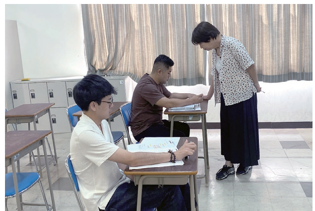
専門学校 山形Vカレッジで日本語を学習する様子

このため本事業では、県人会の将来を担う若い世代を対象に、日本および本県に関心を持ち続けてもらうために、南米の山形県人会から推薦された人を研修員として本県に受け入れています。2024年度は7月下旬から10月中旬の約3カ月間、ブラジルから1人、ペルーから1人が来県し、それぞれが日本語の研修や本県農業に関する技術研修に取り組みました。