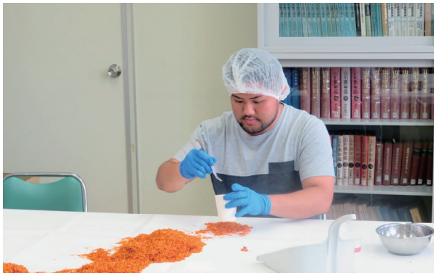
県農業総合研究センターで技術研修に取り組む様子

開催するなど、県内の若い世代と直に交流する機会も持ちました。加えて、ホームステイや県内企業などの見学、自身のルーツを探る観光地視察など、ふるさと「山形」に対する興味や関心を高めてもらう機会の充実を図っています。