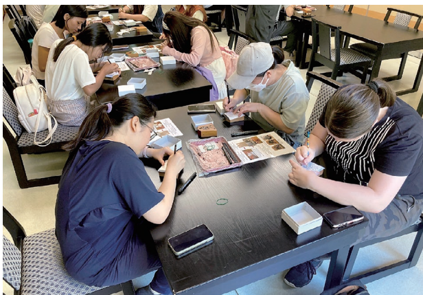
将棋の書き駒体験の様子

2024年6月に実施したツアーでは、本県の主要な観光地である月山や慈恩寺を訪れたほか、さくらんぼ狩りや将棋の書き駒作成を体験しました。